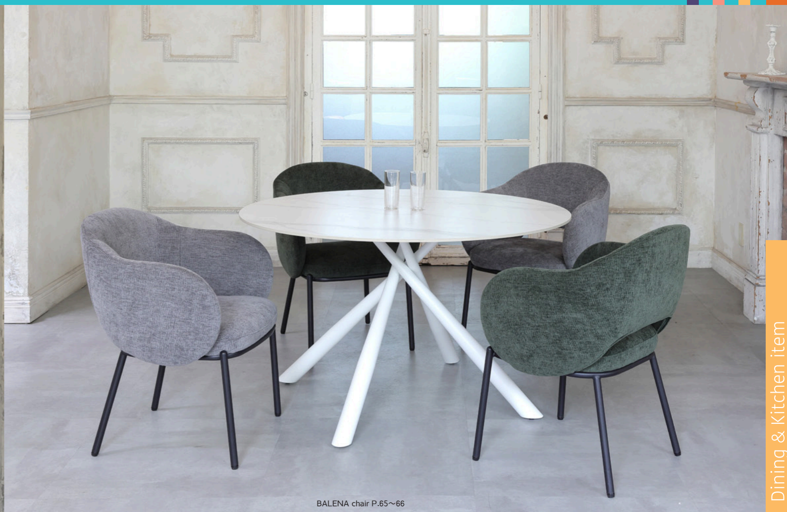
BALENA chair P.65~66